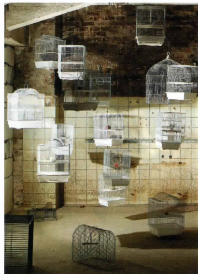
Pohled do části environmentální instalace Horizont událostí Kamily Ženaté v Karlin Studios v Praze.

v instalaci Oplakávání (Ženský dvůr, 2013, viz At. č. 14-15/13). V Karlin Studios nyní navádí koridor hned od vstupu do galerie návštěvníka mezi zadní stranu „ohrady“ a bílou zeď, na níž jsou drobným, úhledným rukopisem vepsány poněkud enigmatické, přímo však povědomě znějící textové koláže. Pečlivá textura připomínající blahé paměti klasický váleček. Zastavuji se a namátkou čtu: „Mám k dispozici nový pokoj. Je celý bílý, čistý, nezařazený. Líbí se mi. Plánuju, jak ho zařídím, kam umístím nábytek. Potom slyším babičku, jak šeptá mámě něco o mojí sexualitě, stydím se za to. Mám pocit, že to všichni vědí... Nepříjemný pocit studu.“ Vymezená cesta mně směřuje ke schodům. Vedou mě dolů. Do sklepa. A ještě mnohem hlouběji: do podsvětí. Horizont událostí. Tentokrát Kamila Ženatá zve k účasti na ojedinelém experimentu. Nava-